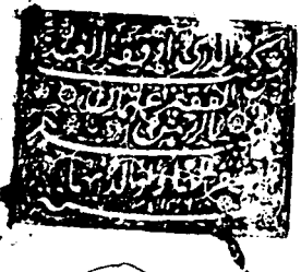
صورة الورقة الأولى من «اليواقيت والدرر»